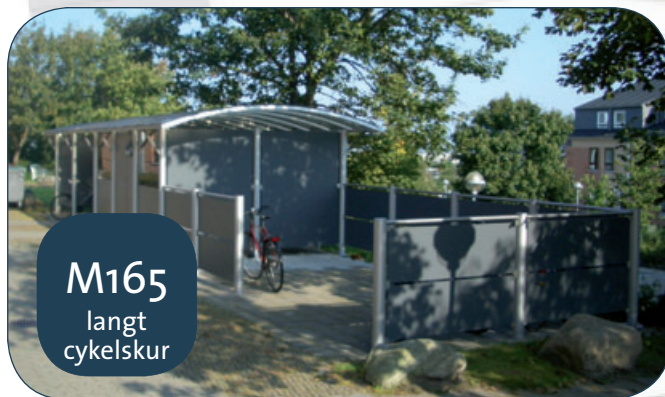
M165 langt cykelskur

3x2 stk. model S396 dobbelt i forlængelse anvendt som cykelskur med plads til 120 cykler (Tarm).