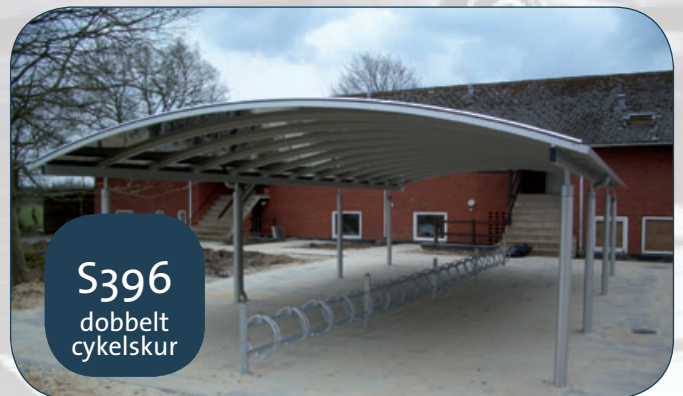
S396 dobbelt cykelskur

Model M165 enkelt anvendt som cykelskur med side og gavle i bronzetonet hærdet glas (Daugård).