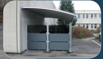
1/2 M330 vægmodel med gavl.

1/2 M330 vægmodel med sorte tagplader anvendt som cykelskur. Delvist lukket med gråtonet hærdet glas og Iron Grey højtrykslaminatplader (Farum).