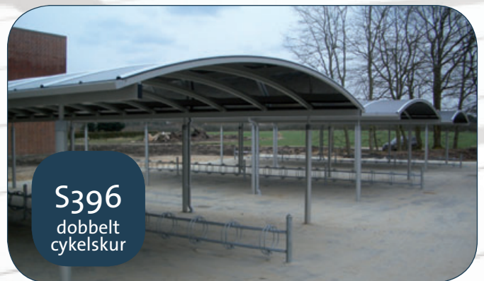
S396 dobbelt cykelskur

2 stk. model M165 i forlængelse m/åben og lukket cykelskur udført i Iron Grey højtrykslaminatplader og med 22 m 2 solkrog (Aalborg).