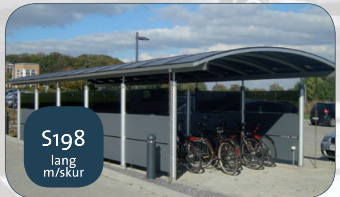
S198 lang m/skur

2 stk. model S198 á 12 m anvendt som cykelskur. Den ene med lukket redskabsskur på 13 m 2 (Juelsminde Skole).