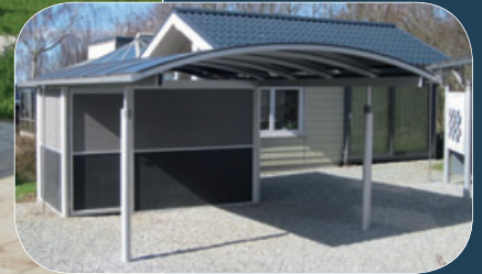
Model S198 std. med 6,5 m 2 lukket skur udført i BASES profiler og fibercementplader