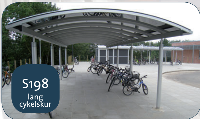
S198 lang cykelskur

2 stk. model S198 á 12 m anvendt som cykelskur. Den ene med lukket redskabsskur på 13 m 2 (Juelsminde Skole).