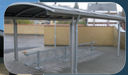
Model S198 med sorte tagplader anvendt som cykelskur med plads til 20 cykler (Svendborg).

Model S198 med sorte tagplader anvendt som cykelskur med plads til 20 cykler (Frederikshavn).