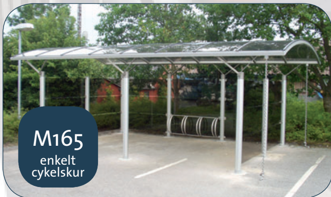
M165 enkelt cykelskur

1/2 M330 vægmodel med sorte tagplader anvendt som cykelskur. Delvist lukket med gråtonet hærdet glas og Iron Grey højtrykslaminatplader (Farum).