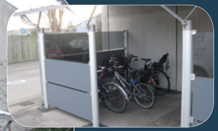
Delvist lukket side med gavle.